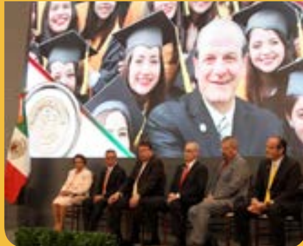
La presea se entregó a 11 ciudadanos en el Patio Central del Palacio de Gobierno.